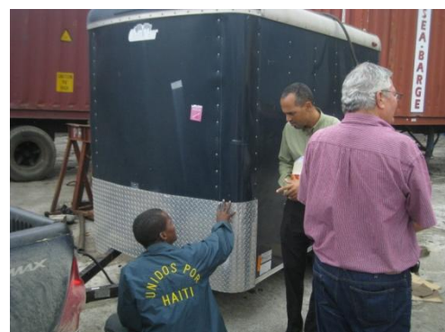
Retirando del puerto el remolque donado por la Iglesia Universal de Jesucristo de Rio Grande, Puerto Rico

Este proyecto NO es de una persona. Es de Dios. Tampoco es ejecutado por la decisión de uno o un pequeño número de personas. El cuerpo directivo es quien conduce la organización siguiendo los propósitos de Dios establecidos en las Sagradas Escrituras y en la relación personal con nuestro Padre Celestial.